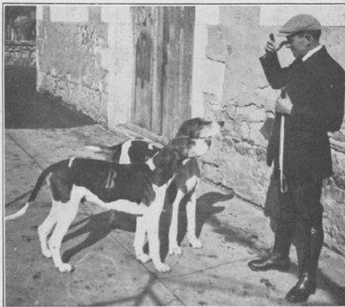
FINISTÈRE, de l'équipage Beynac.